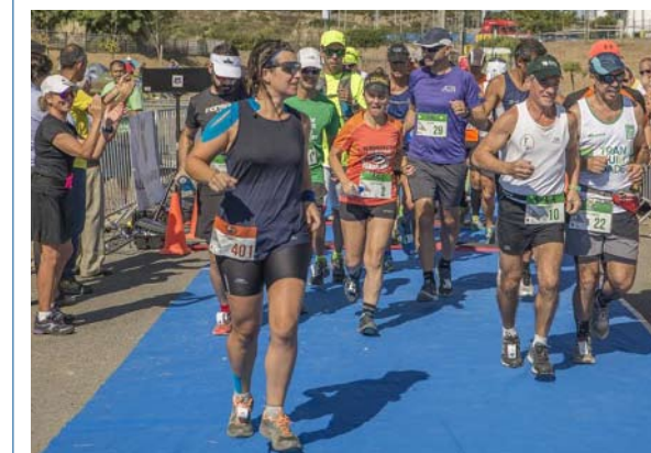
Os Kotas venceram a prova na categoria por Equipas Masculinas. Fizeram cerca de 250 kms

Prova foi uma iniciativa da Ass. Desportiva Real Academia.