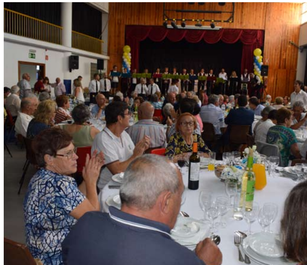
Ao longo deste ano já se realizaram diversos passeios e festas gratuitas para os mais velhos

1 de outubro celebrou-se o Dia Internacional do Idoso, por isso, a Junta de Freguesia de Algueirão-Mem Martins, à margem dos passeios sénior que tem realizado ao longo deste ano, celebrou com pompa e circunstância este dia.