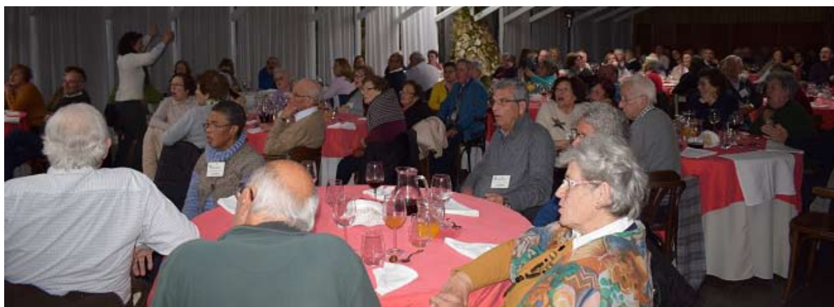
Almoço com tarde dançante é já uma tradição nos passeios

Dia 24 de Novembro realizou-se aquele que foi o último passeio sénior deste ano.