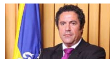
PRESIDENTE DA MESA DA ASSEMBLEIA