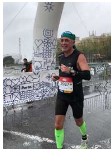
Maratona contou com a participação de 16 mil atletas

As equipas foram campeãs nacionais em veteranos femininos e masculinos e um orgulho para a nossa freguesia.