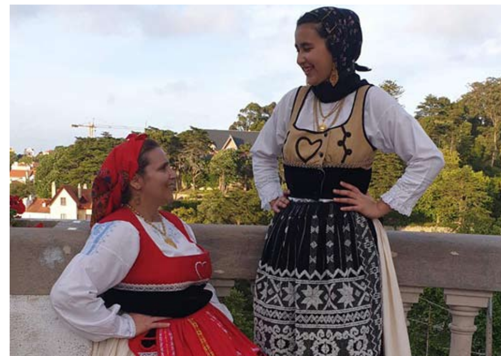
As “Florinhas do Minho” foram um dos ranchos presentes na festa

O último fim de semana de maio foi de festa em várias localidades da freguesia.