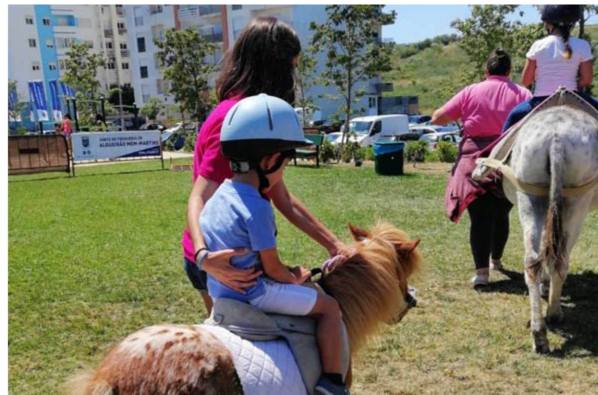
Burros do Magoito são já presença obrigatória nas festas do Dia da Criança

Já pelo corredor do Parque Urbano da Cavaleira estavam os já habituais comerciantes locais... não faltou o pão com chouriço, as farturas, tasquinha dos sabores e as bolas de Berlim; mas o que era interessante ver nesta festa, eram as instituições de solidariedade social locais que vieram aqui, não