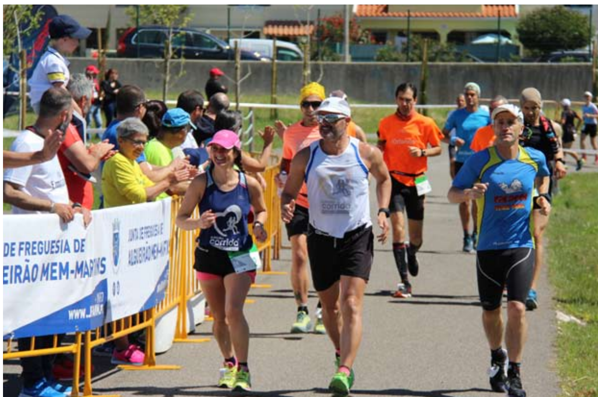
Na edição deste ano, houve 31 classificados nas 24 horas, com mais de 42 km (+ 9 que em 2018)

Prova já está cotada no Deutsche Ultramarathon Verengung desde a primeira edição e recebeu alguns dos melhores atletas nacionais da modalidade.