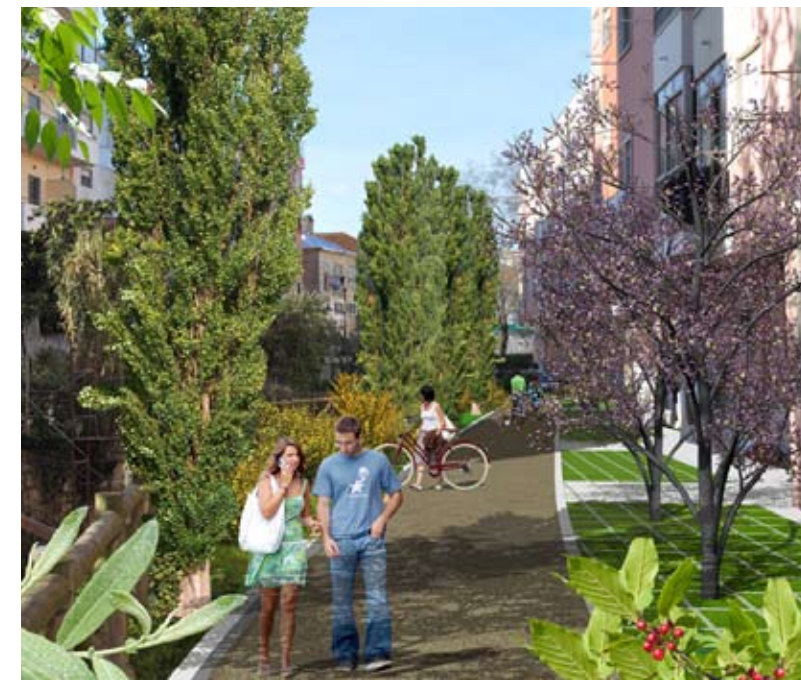
Reabilitação abrange Mem Martins e Rio de Mouro

Considerando todos os perigos já indicados, em setembro de 2015, a Assembleia Municipal de Sintra aprovou, sob proposta da Câmara Municipal de Sintra, o programa estratégico para a Área de Reabilitação Urbana (ARU) de Mem Martins / Rio de Mouro (MMRM) que incluía como vertente muito importante o projeto de Requalificação da Ribeira da Laje. Desta forma e consciente de que esta ribeira é por eleição o fio condutor das intervenções no espaço público, promovendo a dinamização económica, social e cultural das áreas abrangentes, a Câmara Municipal de Sintra, juntamente com as Juntas de Freguesia