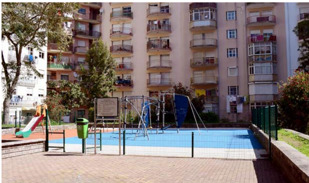
Parque Infantil Francisco Ramos da Costa

Intervenção tem um prazo de execução de 6 meses e prevê um investimento de 250 mil euros