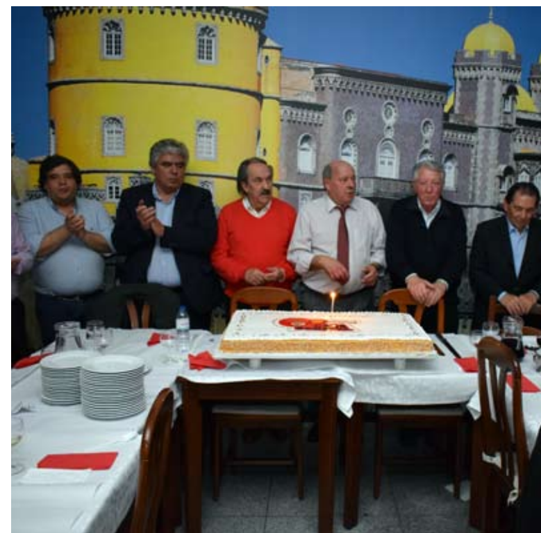
9º Aniversário da Casa do Benfica em Algueirão-Mem Martins/Sintra

Para além disso, o presidente da casa reforçou a aposta que tem sido feita nas duas modalidades desenvolvidas pela casa do Benfica, o pool e o atletismo, e o crescimento e sucesso que ambas têm tido. “No atletismo contamos hoje com mais de 100 atletas inscritos, que participam semanalmente em provas que vão decorrendo da grande região de Lisboa. Em termos coletivos somos campeões regionais e nacionais em corta-mato curto e longo, e ainda campeões nacionais veteranos em estrada. No Sintra a correr, a importante prova de atletismo no nosso concelho, somos