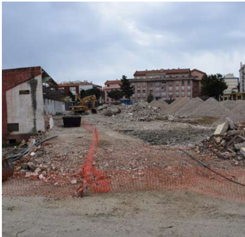
Demolição dos armazéns na antiga Fábrica da Messa

Nova unidade de saúde representa um investimento de 4 milhões de euros