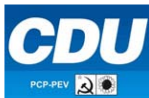
CDU Bancada da CDU