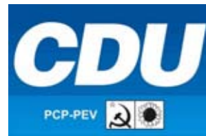
CDU Bancada da CDU

A Junta PS/CDU ficou a milhas desta exigência, preferindo a ociosa política de “gestão orçamental de continuidade”, com os efeitos que se conhecem.