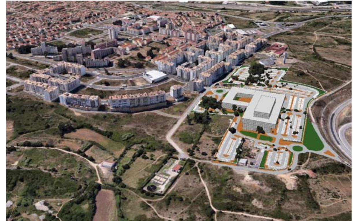
A Urbanização da Cavaleira foi o local escolhido para a instalação do novo hospital

O novo equipamento contempla, para consultas externas, 23 gabinetes mais 5 gabinetes de reserva, sendo possível ampliar o número de especialidades. A consulta externa funcionará durante 12 horas por dia e prevê, no primeiro ano, mais de 166 mil consultas. Estará ainda contemplado com uma unidade de Saúde Mental, uma área clínica de Psiquiatria de Adultos e uma área clínica de Psiquiatria da Infância e Adolescência. Esta unidade terá 15 gabinetes (6 gabinetes