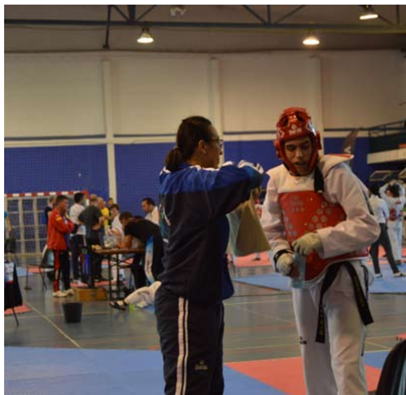
Associação Juvenil de Sintra (TTT) conquistou 9 primeiros lugares

A prova foi um sucesso para a Taebaek Triângulo Taekwondo – Associação Juvenil de Sintra (TTT), que conseguiu arrecadar 9 primeiros lugares, 3 segundos lugares e 5