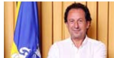
BE Valdemar Reis

E termino, convidando a população local a votar nas próximas eleições autárquicas, é um dia diferente para todos. A freguesia de Algueirão-Mem Martins necessita do vosso apoio para melhor servir as suas gentes. Contamos convosco.