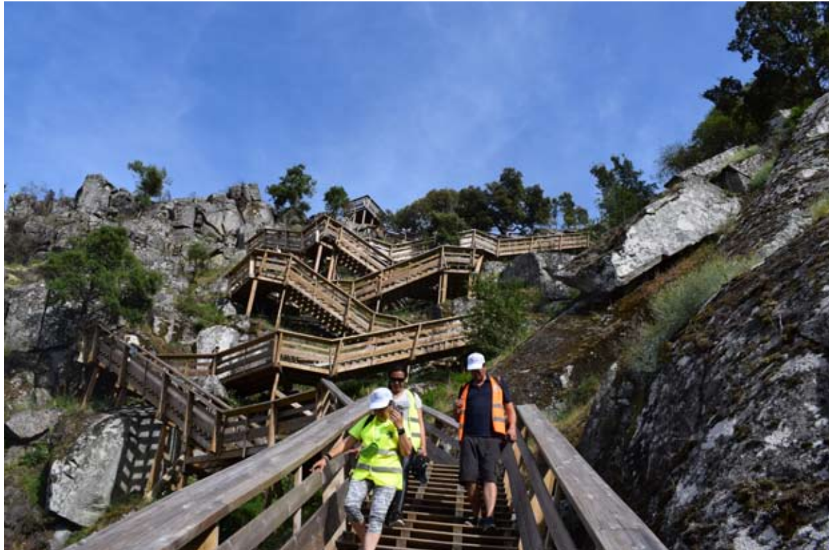
Passeio contou com a coordenação da GimnoAnima

Percurso tem um total de 8km e estende-se entre as praias fluviais do Areinho e de Espiunca