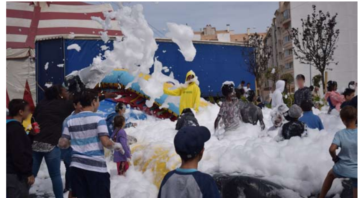
Os mais novos aproveitaram as atividades para se divertirem e brincarem com os amigos

O circo foi a grande novidade da festa do Dia da Criança e sem dúvida nenhuma a grande atração e destaque deste dia inesquecível para os mais pequenos. As duas fantásticas sessões de circo, uma de manhã e outra à tarde, que tiveram a particularidade de serem realizadas sem a presença de qualquer animal, animaram por completo toda a plateia. Foi impressionante ver os mais graúdos a vibrar intensamente com a magia do circo e a renderem-se aos encantos de soltar