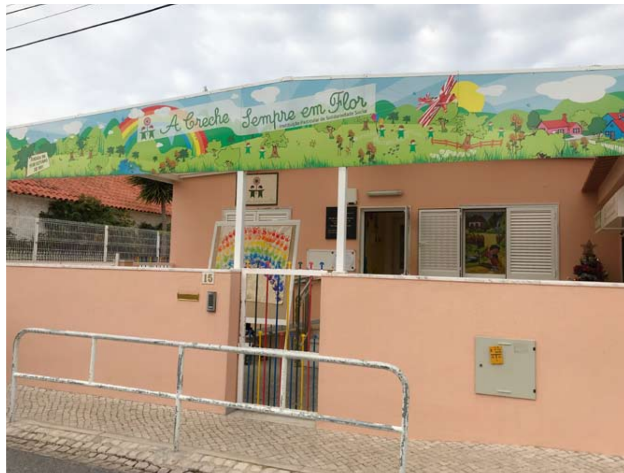
A Creche Sempre em Flor conta hoje com 350 crianças

JFAMM – Qual é o principal foco e objetivo da Creche?