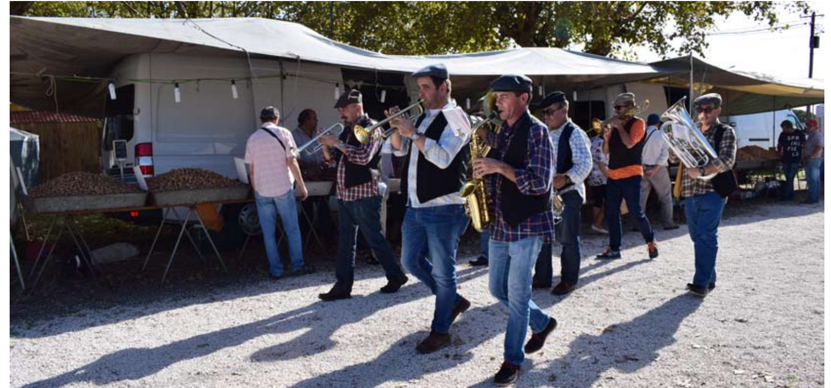
Feira da Mercês decorreu nos dias 20, 21, 22, 27, 28 e 29 de outubro

A emblemática festa saloia foi organizada pela Câmara Municipal de Sintra e realizou-se no habitual recinto tradicional da feira