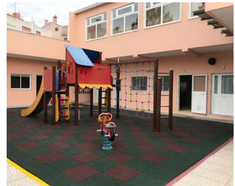
Parque Infantil inserido num dos edifícios da Creche Sempre em Flor

Sonhamos igualmente em criar uma casa de acolhimento, há muitas crianças deste concelho que são maltratadas pelos pais e que têm que ir para Braga ou Algarve. Faz falta haverem mais casas de acolhimento, mas para isso precisamos de um terreno, de apoios financeiros e de ter vários parceiros