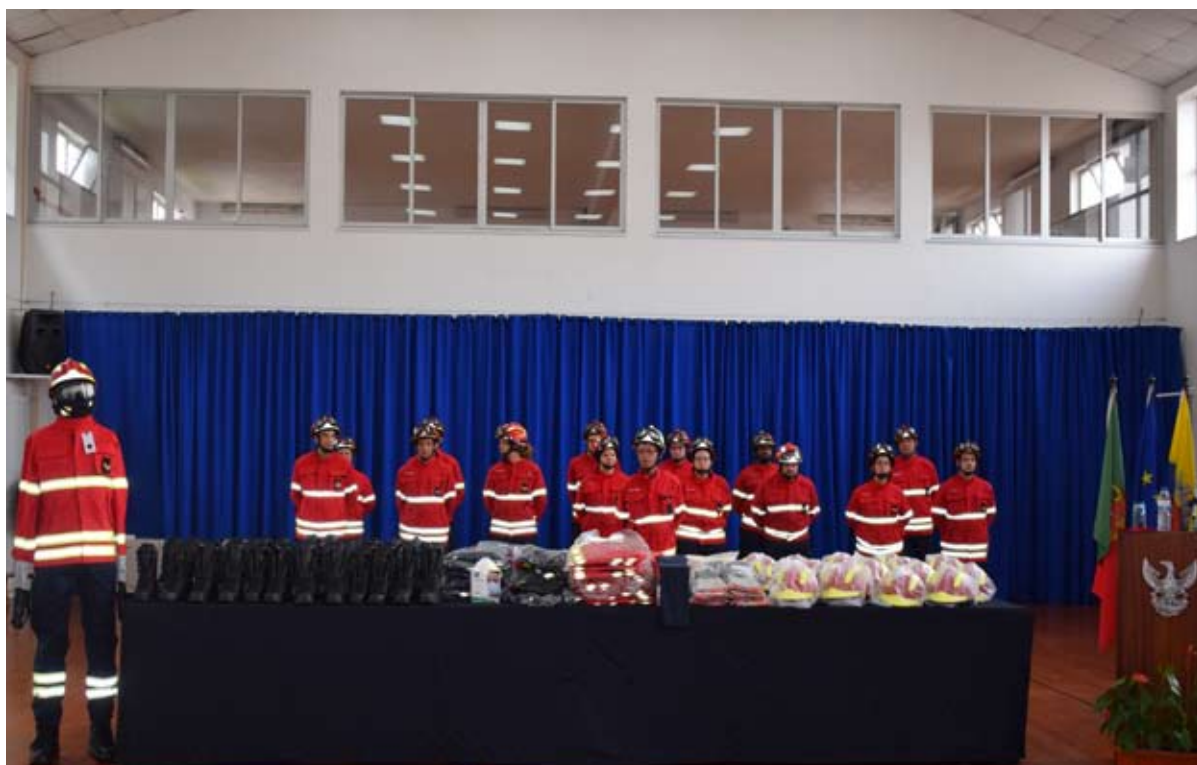
Entrega de equipamentos decorreu no salão nobre dos Bombeiros Voluntários de Algueirão-Mem Martins

Junta de Freguesia de Algueirão-Mem Martins procedeu à entrega de 20 conjuntos completos de equipamentos de proteção individual